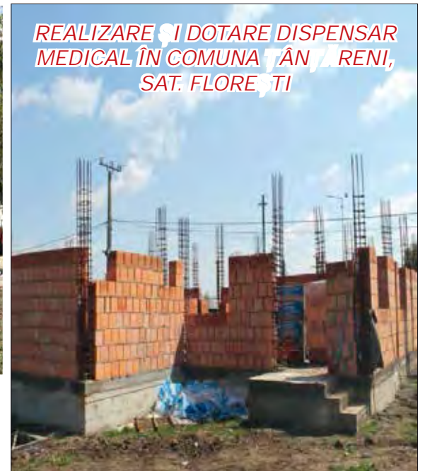
REALIZARE ȘI DOTARE DISPENSAR MEDICAL ÎN COMUNA ȚÂNȚĂRENI, SAT. FLOREȘTI

Este un proiect important pentru comunitatea locală, prin care se vor îmbunătăți semnificativ serviciile medicale oferite cetățenilor comunei.