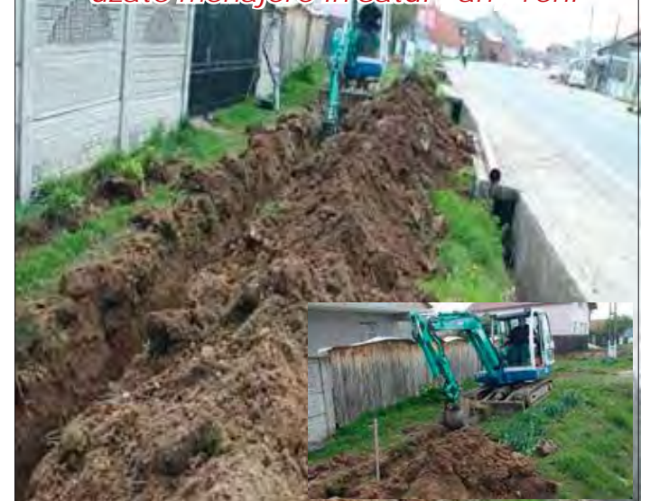
Sistem de canalizare și epurarea apelor uzate menajere în satul Țânțăreni

În această perioadă lucrările de canalizare se desfășoară în satul Țânțăreni. Avem rugămintea ca toți cetățenii să se racordeze. Totodată ne cerem scuze pentru neplăcerile create!