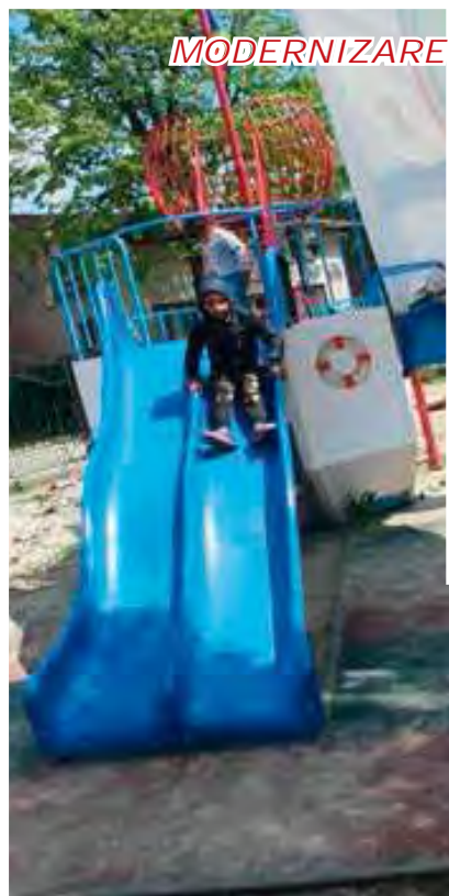
MODERNIZARE PARC ÎN SATUL ȚÂNȚĂRENI + STATUIA TUDOR VLADIMIRESCU

În această perioadă lucrările de canalizare se desfășoară în satul Țânțăreni. Avem rugămintea ca toți cetățenii să se racordeze. Totodată ne cerem scuze pentru neplăcerile create!